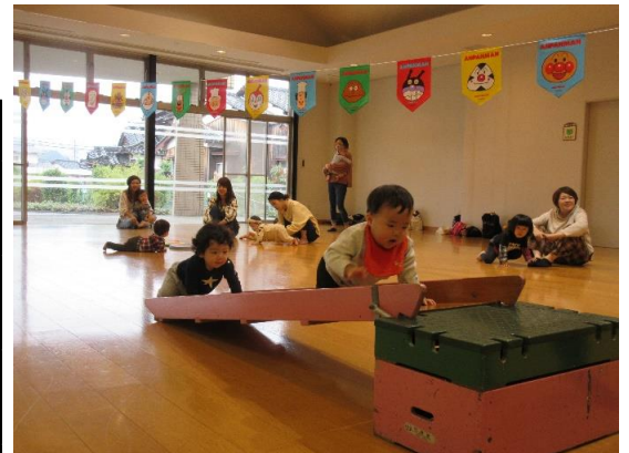
「ハイハイ上手だね～」うんどう会したよ