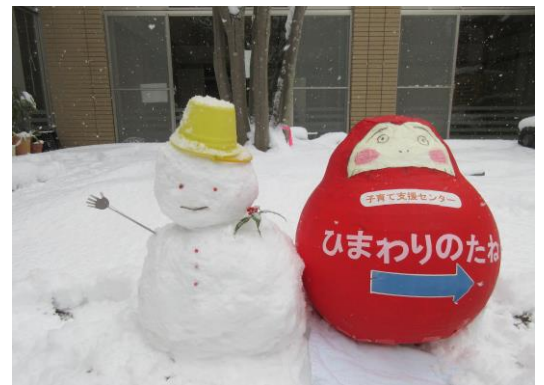
ひまわりのたねのだるまちゃんと雪だるま！