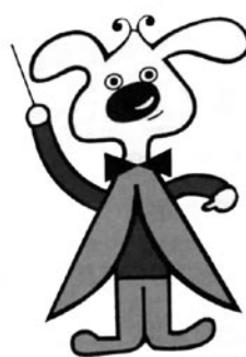
年金マスコットキャラクター ピッコロくん

また、郵便局の「郵便振替」に変更するときは、郵便局で郵便振替口座の口座番号についての証明を受けてください。 住所が変わるときは、社会保険事務所などへ届を提出するとともに、旧住所の郵便局にも届け出てください。