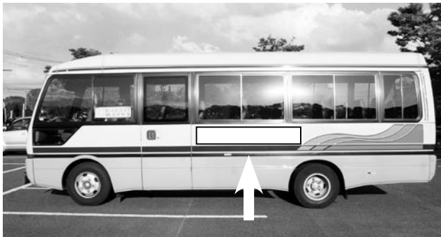
広告のマグネットは、両側面に貼られます。

詳しくは、総務課(☎65・1100)、または11月からの桂川町のホームページ( http://www.town.keisen.fukuoka.jp/ )をご覧ください。