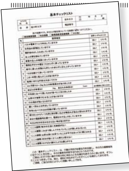
▲こちらが「基本チェックリスト」の調査用紙です。