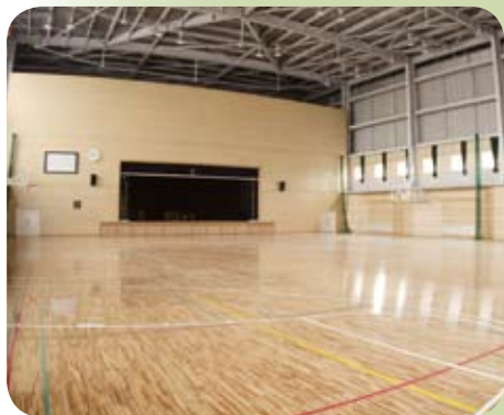
▲ 天井が高く明るい体育館