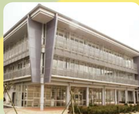
▲ 全面ガラス張りで中庭が見渡せる食堂