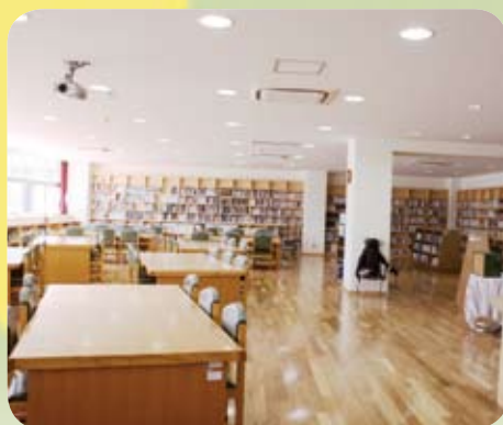
▲ ゆったりした造りの図書館