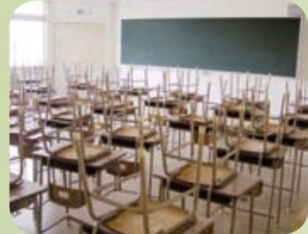
▲ 共に学び、友情を育んでいく新しい教室