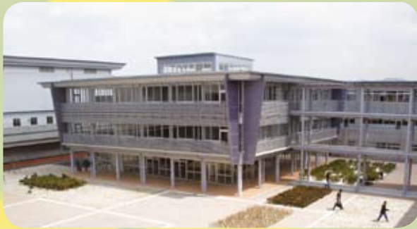
▲ 嘉穂総合高校目玉の一つ「メディア棟」

2階は、生徒の学校生活の拠点となる教室が中心になっています。その教室の窓から外を眺めると、なんと桂川町の風景が巨大なパノラマ写真のように広がっています。 また、情報を基調とした学校のため、教室でもパソコンを設置し、インターネットやメールができる環境が整備されています。 次は、いよいよ校舎中央に位置するメディア棟です。