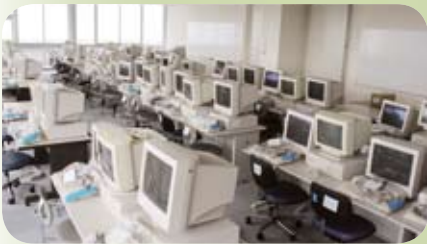
▲ 大人数での学習が可能なコンピュータ室