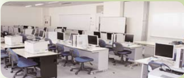
▲ 設計・製図等を学ぶためのコンピュータ室

実は、嘉穂総合高校は、このメディア棟を中心に設計・構築がなされ、情報教育を中心にすえた嘉穂総合高校のシンボリックな建物です。 2階、3階の各教室に設置されたパソコンの数は約250台。全教科で、パソコンを使った授業を行い、毎時間フル稼働で、利用されている施設です。さらに、大手ファッションデザイナーを手がける企業並のソフトも導入されていて、ここから世界へ羽ばたく若者が出てくる日が、楽しみです。