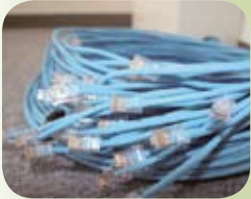
▲ コンピュータ増設用のネットワークケーブルの束