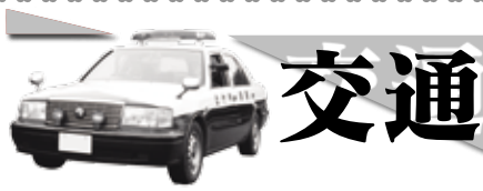
交通事故発生状況 (11月中)

飯塚署管内【飯塚市・嘉麻市(旧稲築町)・桂川町】 発生件数 143件 (1,314) 負傷者数 201人 (1,808) 死亡者数 2人 (6)