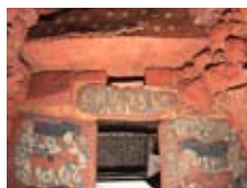
▲前室後壁レプリカ

王塚古墳は6世紀に造られた前方後円墳で、全国に多数ある装飾古墳の中でも超一級の装飾古墳です。60年前の1952年、国の特別史跡に指定されました。