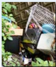
▲6月上旬の湯の浦森林公園での不法投棄。