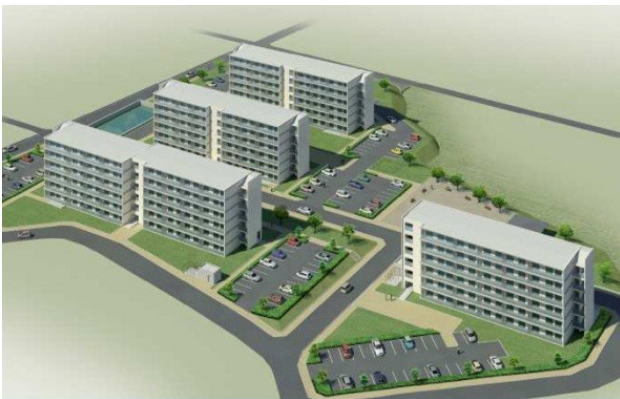
▲集約化・建替え後の町営住宅（二反田団地）イメージ図

今後は、平成28年度に建物の基本設計と実施設計を行うとともに、第一棟目の建築用地の造成工事を行います。そして、平成29年度から建築工事に着手し、平成30年度の完成を目指します。