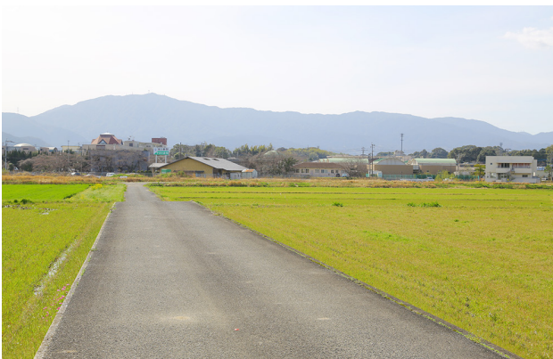
▲県道豆田稲築線整備予定箇所の一部。

今後は、文化財の調査や一部工事の着工、用地補償契約の締結などに本格的に取り組んでいくとのことです。