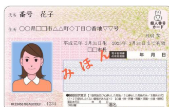
▲マイナンバーカードは、本人確認の身分証明として使用可能です。

社会保障・税番号制度、いわゆるマイナンバー制度については、番号の利用が1月1日から開始されました。本町では、すでに申請していた方のマイナンバーカードを、2月1日から交付しています。