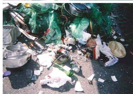
▲車内火災で緊急停止したごみ収集車。