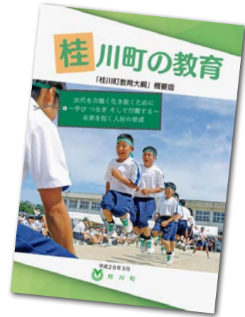
▲「桂川町教育大綱」概要版