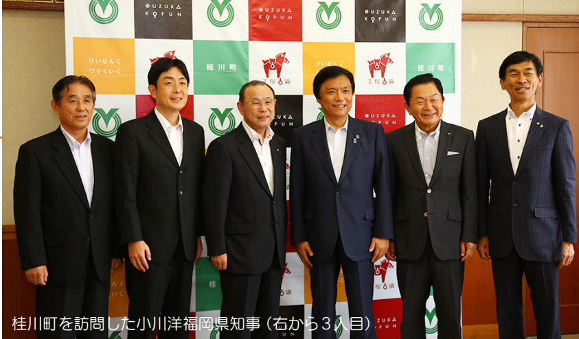
桂川町を訪問した小川洋福岡県知事(右から3人目)