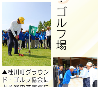
▲桂川町グラウンド・ゴルフ協会による案内で実際にプレー。もう少しでホールインワンというニアピンショットに、「やみつきになりそう」と小川知事。