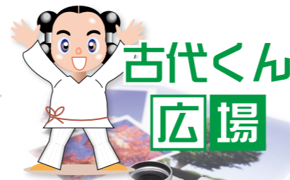
王塚装飾古墳館 マスコットキャラクター 古代くん