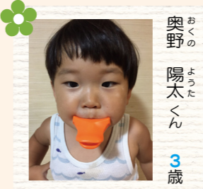
奥野 陽太くん 3歳 誕生日おめでとう! モリモリ/食べてピーマンマンに♡