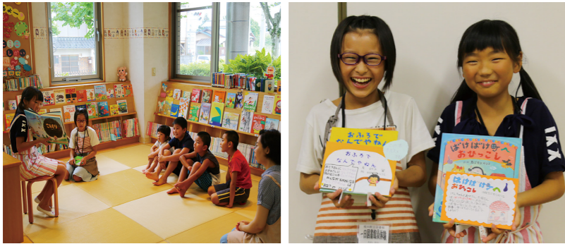
▲(写真左)「とっても緊張した」と話してくれた絵本の読み聞かせ。心のこもった読み方に、聞いていた子どもたちも笑顔になりました。(写真右)本を紹介するPOP作り。おすすめの本を選んで、とてもわかりやすく、かわいいPOPができました。

■図書館員を体験しました！ 8月3日(木)、小学6年生2名が「一日図書館員体験」に参加しました。「一カ月に10冊近くは本を読む」と嬉しそうに話してくれた本好きの二人。本の貸出や返却の受付、絵本の読み聞かせなど、図書館員の仕事に緊張しつつも、大好きな本に囲まれながら楽しく仕事をしました。