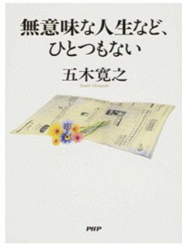
▶無意味な人生など、ひとつもない 五木寛之／著者