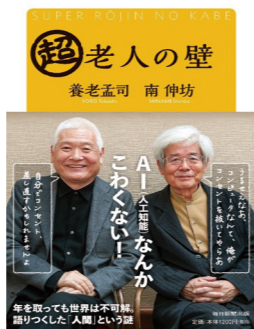
▶超老人の壁 養老孟司 南仲坊／著者

9月18日は敬老の日です。「敬老の日読書のすすめ」として、おすすめの本を紹介します。この機会に一度読んでみませんか。