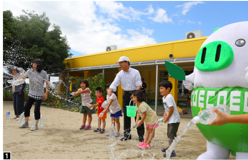
1 「3・2・1」の掛け声とともに、園児たちがグラウンドに水をまきました。マスコットキャラクターの「エコトン」も駆けつけてくれ子どもたちも大喜びでした。