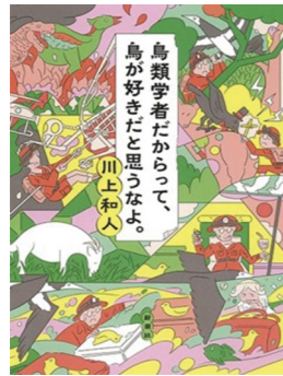
▶鳥類学者だからって、鳥が好きだと思ふなよ。 川上和人／著者