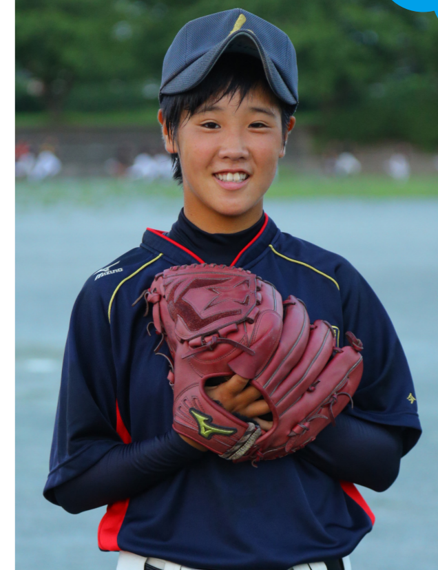
学校法人神村学園高等部 野球部