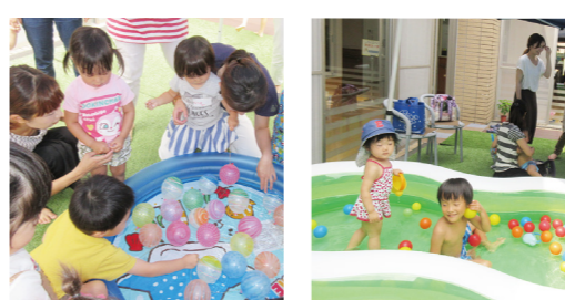
▲(写真左) 夏まつりのヨーヨー釣り。たくさん子どもたちとゲームなども楽しみました。(写真右) 夏と言ったらこれでしょ！のびのび水あそび～！

■プール遊びで夏を満喫 今年の3月までよく遊びに来ていた子どもたちが、夏休みになって久しぶりに顔を見せてくれました。会話やしぐさを見てみると、5カ月でこんなにも落ち着くものかと思えました。集団生活の中でいろいろな経験をして成長しているのでしょうか。 ◇ ◇ 水遊びは、解放感を与えと言いますが、初めて一緒になった子どもたちも、水をかけ合ったり、あつという間に仲良く遊び始めます。 ◇ ◇ 日ごろは年下ばかりの中で、エネルギーを持て余していた4歳の男の子。プールと一緒に5歳の男の子に一目惚れ？側について回って同じ遊びをして ◇ ◇ 夏休みが終わり、毎日にぎやかだった子育て支援センター「ひまわりのたね」も今月からは少し静かになることでしょう。少しさみしい気もしますが、9月からはハイハイやよちよち歩きの子もたちが、次は私たちが僕たちの番だというように動きますことでしょうか。お母さんたちと子どもの遊びを見守っていきたくと思います。 ◇ ◇ 夏休みが終わり、毎日にぎやかだった子育て支援センター「ひまわりのたね」も今月からは少し静かになることでしょう。少しさみしい気もしますが、9月からはハイハイやよちよち歩きの子もたちが、次は私たちが僕たちの番だというように動きますことでしょうか。お母さんたちと子どもの遊びを見守っていきたくと思います。