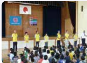
▲桂川小学校にて紹介される見守り隊の方々。

桂川小学校・東小学校の2学期の始業式で、登校時に通学路の挨拶・見守り活動をしている方々の紹介が行われました。交通量の多い交差点などで毎朝子ども達を先導している方々を知ってもらう取り組みです。