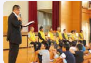
▲桂川東小学校にて紹介される見守り隊の方々。