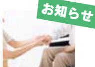
図 社会教育課 社会教育係 ☎65・2007

【日 時】10月28日(土)、29日(日) 9時～16時 【場 所】住民センター、総合福祉センター「ひまわりの里」、いきいきセンター「桂寿苑」など 【内 容】展示・催し・ステージなど 【その他】内容や時間などの詳細は、後日各戸配布するチラシをご覧ください。