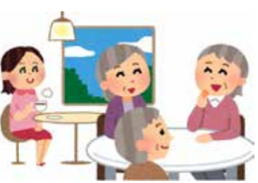
図 健康福祉課 高齢者・女性係 ☎65・0001