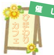
図 桂川町グラウンド・ゴルフ場 ☎65・5272

【日 時】11月7日(火) 【場 所】桂川町グラウンド・ゴルフ場 【その他】10月10日(火)までに申込