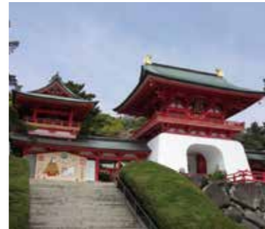
▲赤間神宮のシンボル「水天門」

【日時・場所】 ○事前研修 11月1日(水) 10時～12時 住民センター視聴覚室 ○視察 11月11日(土) 8時50分～17時 下関市壇ノ浦周辺及び北九州市門司港レトロ地区 【対象】町内在住者または勤務者で、事前研修・視察ともに参加可能な方 【その他】参加費10000円(入館料・保険代など)。10月20日(金)までに要申込(定員20人・応募多数時抽選) ※昼食代は自己負担(唐戸市場)