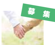
図 桂川町体育協会 ☎65・5145

【日 時】10月22日(日) (開会式) 8時30分～ ※雨天中止 【場 所】総合グラウンド、第一町民グラウンドほか 【その他】参加資格など詳しくはお問い合わせください。