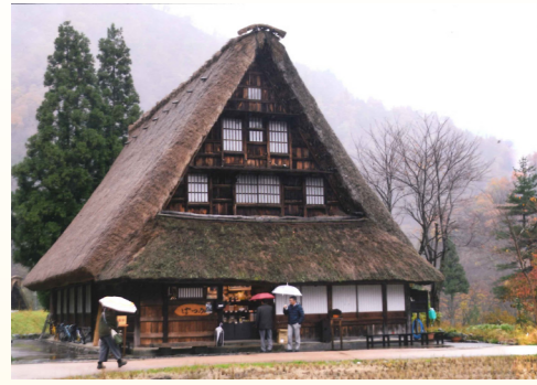
「雨の五箇山」