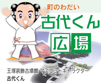
王塚装飾古墳館 マスコットキャラクター 古代くん

福岡県ひとり親就業・自立支援センター 飯塚プラザ 〈就業支援・養育費の電話相談〉 ☎21・0390 〈無料弁護士相談〉 ☎092・584・3031 HP http://fukuoka-kenboren.jp/