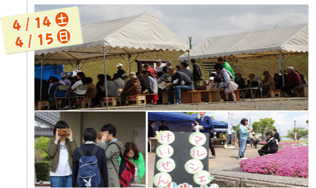
▲VRスコープを体験する来場者。 ▲けいせんマルシェなどたくさんのブースが出店しました。