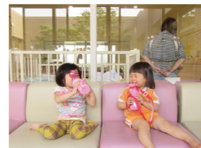
「別々の幼稚園に行き出したけどここで会えるね！」