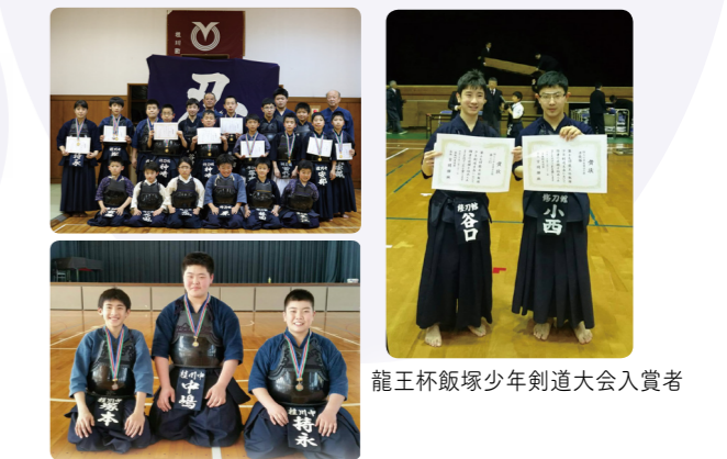
龍王杯飯塚少年剣道大会入賞者 嘉飯地区少年剣道錬成大会入賞者