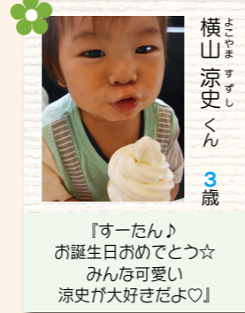
横山 涼史くん 3歳 『すーたん』お誕生日おめでとう☆みんな可愛い涼史が大好きだよ♡