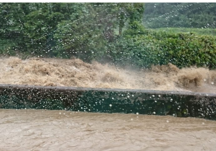
▲奥：泉河内川（徳力橋付近） 手前：冠水する桂川下秋月線