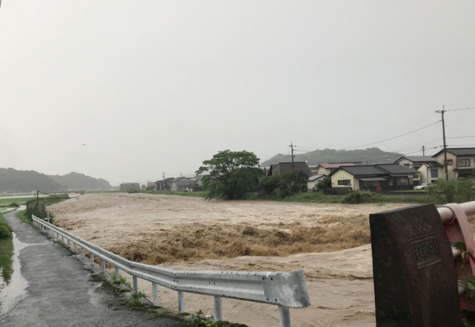
▲豆田橋付近から撮影した穂波川の様子。