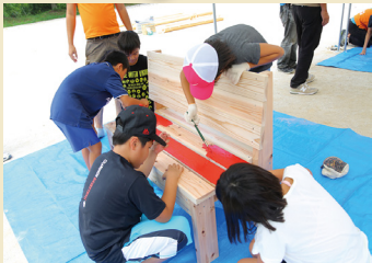
子どもたちの自由な発想でペンキの色塗りをを行います。