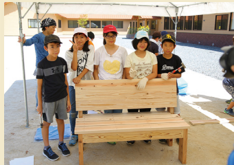
ベンチの枠組みが完成！記念に一枚パシャリ。