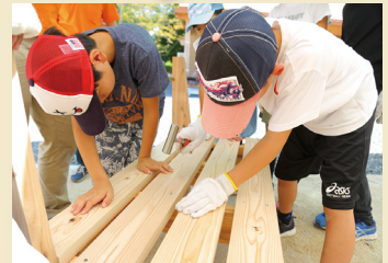
金槌を使用し釘を打ち、ベンチの枠組みを作成します。