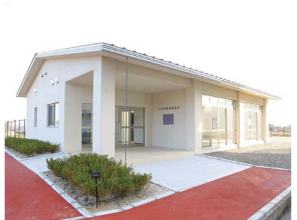
▲二反田団地建替えに伴い新築された二反田団地集会所。