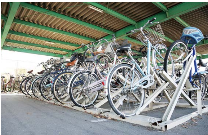
みんなの駐輪場です！ ルールを守って利用しましょう！