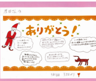
▲ 桂川中3年生より贈られた感謝状の一部

「おはようございます」桂川中体 育館前、元気な声飛び交う。雨の 日、夏の炎天下、冬は吹きさらし、 そんな状況での挨拶運動も16年目を 迎えます。発端は、平成17年中学校 が荒れた折、正常化へ向けた取り組 みの一つでした。最初は中々返事が 返って来なかったが3ヶ月、4カ月 と挨拶を重ねていく内に小さな声で 「おはよう」と返って来た。「正に継 続は力なり」。その後は見る見る正 常化が進み、今では自慢の中学校で す。昨年末には3年生より手作りの 感謝状を関係者一同頂きました。生 徒たちが元気づける挨拶運動が逆に 私たちが元気になり、何ともほのぼ のとした感謝状は一生の宝物となり ました。ありがとうございます。