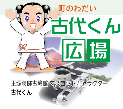
王塚装飾古墳館 マスコットキャラクター 古代くん

2021年元旦。桂川町土師の弥山岳(標高377m)の整備を行っている「グラウス山愛会」「弥山岳を守る隊」による展望所(標高350m)から初日の出を拝む催しが行われました。子どもたちも含め20人が集まり、雲の間から輝く初日の出を見て、参加者は新年の願いをこめました。