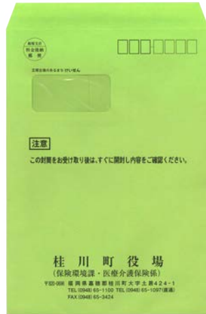
▲今回送付するみどりの封筒とみどりの受診券