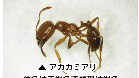
▲アカカミアリ 体色は赤褐色で頭部は褐色 体長3mmから5mm程度