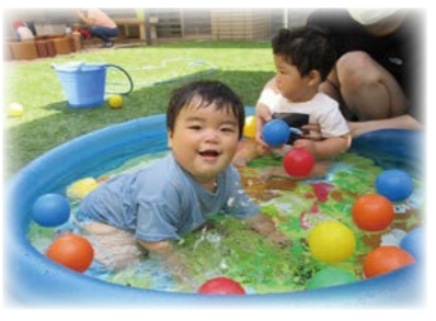
▲待ってた水遊び！気持ちいいな～

子育て支援センター「ひまわりのたね」 【開館】月～金曜日 9～16時 【場所】総合福祉センター「ひまわりの里」内 【対象】0歳から未就学の子どもとその保護者 ※利用には保護者の付き添いが必要です 【利用料】無料