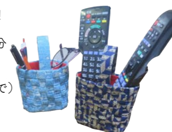
▲布で作った小物入れ

日時/9月26日(日) 13時~16時30分 場所/町立図書館 フリースペース 定員/10名。要申込(8月31日(火)まで) 材料費/500円