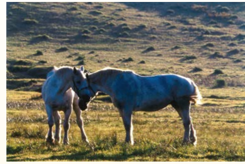
「草原の朝」