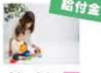
図 住民課 住民生年金係 ☎65・3301

○低所得の子育て世帯生活支援特別給付金(ひとり親世帯以外分) 新型コロナウイルス感染症による影響が長期化する中で、子育て世代の雇用動向が悪化しており、失業や収入減少の中で子育ての負担も担わなければならない低所得の子育て世帯(ひとり親世帯以外)を支援するため、給付金を支給します。