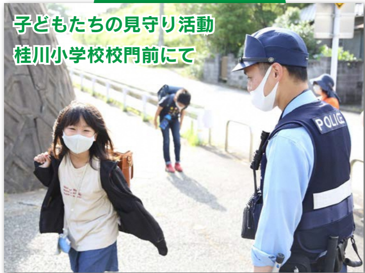
子どもたちの見守り活動 桂川小学校校門前にて