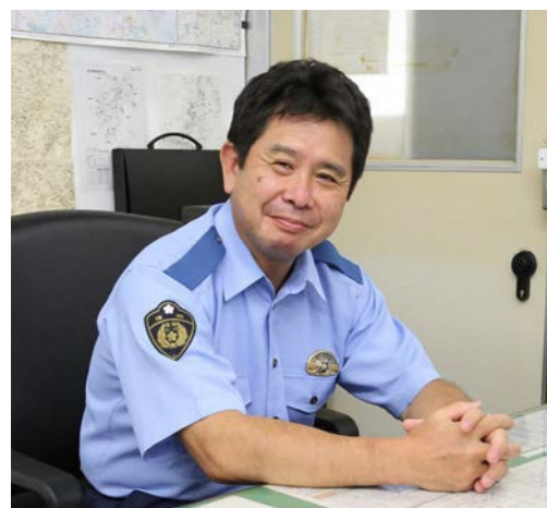
福岡県飯塚警察署 地域管理官

町民のみならずには、桂川交番の活動にご理解とご協力をいただきますようお願いいたします。