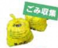
図 保険環境課 生活環境係 ☎65・1097