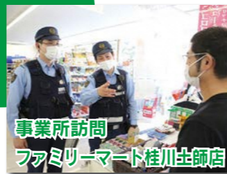
事業所訪問 ファミリーマート桂川土師店