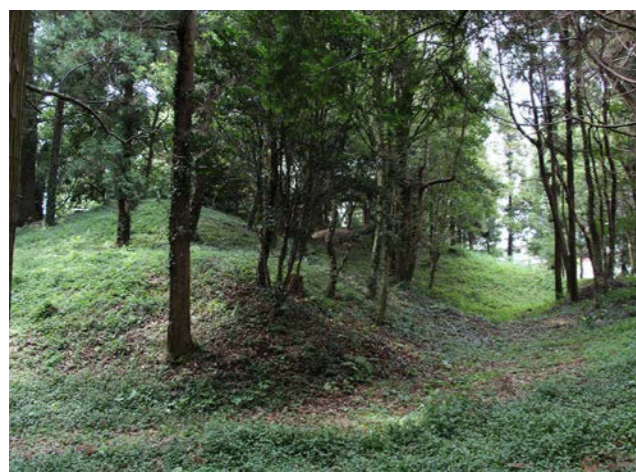
▲ 天神山古墳（平成29年撮影）

全長約68mの前方後円墳で、王塚古墳より後に造られた6世紀中頃（約1450年前）の有力者のお墓です。平成26年度より調査を行っており、古墳の敷地内への出入口である通路状遺構や、騎馬像や犬などの土人形をつけた装飾性の高い焼き物（須恵器）が見つかっています。