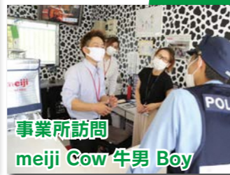
事業所訪問 meiji Cow 牛男 Boy