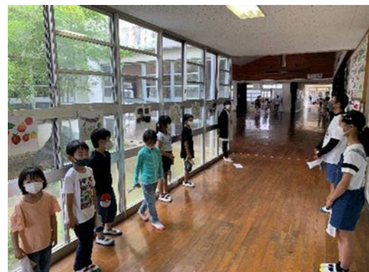
▲1年生～6年生が協力して掃除を行う様子

本校には、1年生から6年生までが混ざって行う縦割り掃除があります。協力して学校中をきれいにしていくことはもちろん大切ですが、真のねらいは、6年生、5年生がリーダー、サブリーダーとしての自覚をもつこと。自分たちで主体的に進められること。1〜4年生に掃除の仕方をわかりやすく教えられることです。6年生が、特に気をつけて進めていることは、