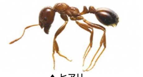
▲ヒアリ 全体は赤茶色で腹部が黒っぽい赤色 体長2.5mmから6mm程度

令和3年6月17日に北九州市門司区にて、特定外来生物である「アカカミアリ」が確認されました。毒針をもつ危険なアリですので、写真のようなアリを見かけましたら桂川町保険環境課までご連絡ください。