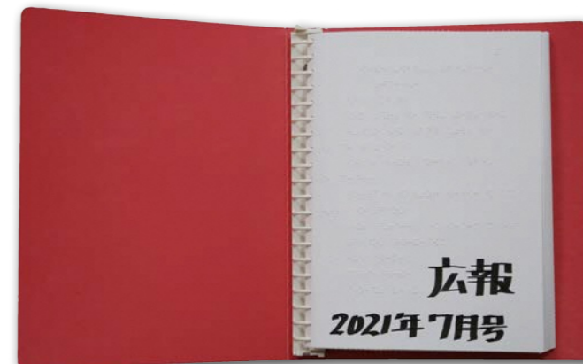
▲点字の広報けいせん