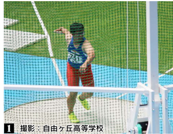
1 撮影：自由ヶ丘高等学校