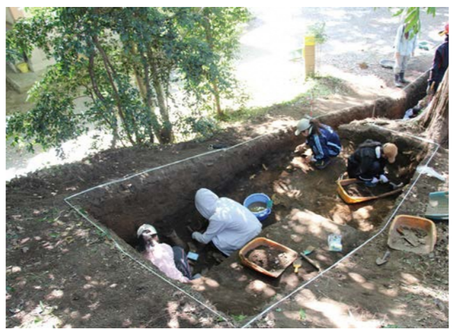
▲ 調査の様子（令和元年）