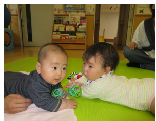
日々の成長が楽しみ!

い?」と心配そうなお母さん。初々しさを感じながら赤ちゃんを抱きあげるとほっとしていました。授乳の時は私たちも距離を置きます。お母さんが母乳やミルクをあげている姿にも癒されます。授乳が済むと、ささやくように話しかけているお母さんを見て、また優しい気持ちになります。子どもを授かったことで、お母さんとして育っていく様子を見せられていきます。子どもが眠っている時は、美味しい店の話や、たわいもない話で笑い合うことも。少しずつ親子でリラックスしてくれればと思います。こうして「ひまわりのたね」は今年度も活気を出しつつあります。