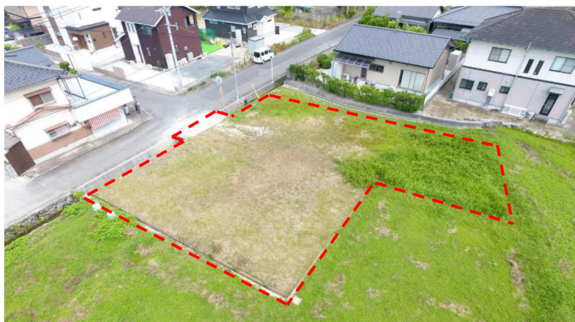
▲今回一般競争入札により売り払いする町有地。

桂川町では、町有地の一般競争入札による売り払いの取り組みを実施します。この取り組みは町の使用していない土地等の売り払いを実施することにより、町有地を有効活用することを目的としたものです。入札参加を希望される方は、下記に示す物件概要や入札条件等をご確認ください。