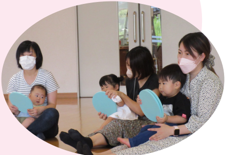
ハンドル上手に持ってるわ