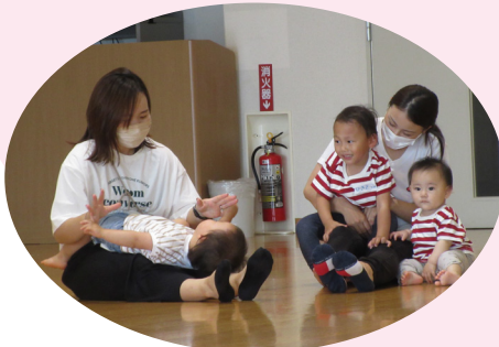
ママのお膝は最高！

申込みが多く、抽選で選ばれた親子8組がリズムに合わせて音楽あそびに参加しました。まだ歩けない赤ちゃんも、お母さんに抱かれながら親子一緒に身体を動かし、笑顔になるひと時を過ごしました。子育て支援講座は、子育てに関する学びや親子の交流を目的とした親子参加型の講座です。今年度も、いろんな催しを予定していますので、ぜひ子育て支援センター「ひまわりのたね」にあそびに来てください。