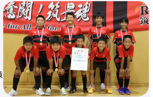
▲桂川町の児童たち。笑顔がまぶしいです。