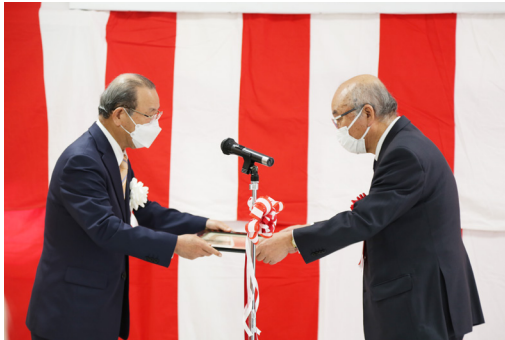
▲二反田団地B棟の建設に携わった建築業者へ感謝状を贈呈しました。