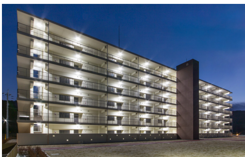
▲二反田団地B棟の夜景