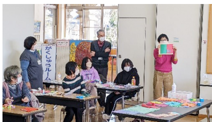
▲参加者の作品を紹介するオーギカナエ先生