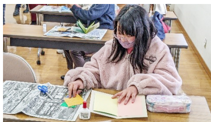
▲「どんな形にしようかな～」