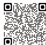
▲桂川町電子図書館 QRコード