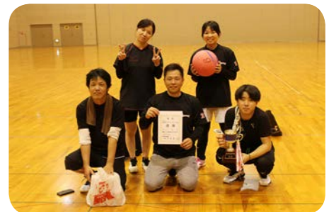
混成ヤングの部 優勝チーム 天道