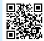
▲詳しい内容はこちら