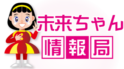
王塚装飾古墳館 マスコットキャラクター 未来ちゃん

📍 桂川町役場 【開庁日】月曜日～金曜日（土曜日、日曜日、祝日及び年末年始は閉庁） 【開庁時間】8時30分～17時15分（木曜日は19時まで一部の窓口が延長） 【電 話】☎0948・65・1100（代表） 【ホームページ】http://www.town.keisen.fukuoka.jp/ 【防災行政無線の放送内容確認電話】☎0120・957・533（フリーダイヤル） 【広報けいせんをインターネット・スマホで閲覧】 ○マイイロ … App store または Google Play から「マイイロ」を検索し、ダウンロード