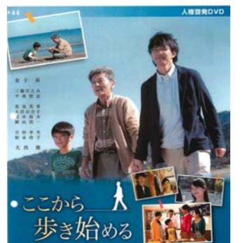
▲今回視聴するDVDです。認知症の父とその家族の葛藤を描いたドラマです。

今回のテーマは「高齢者の人権」です。7月に開催した市民講座「人権講演会」でも「高齢者の人権」を取り上げました。認知症の母親を老老介護する父親と遠距離介護する娘の葛藤の話でした。参加された方々からは、「介護といえば、する側の大変さしか考えてなかったけど、介護される人の人権も大切だ」との声もあり大変好評でした。7月の市民講座「人権講演会」を聞いた方はもちろん、聞き逃した方も一緒に考えてみませんか。若い人から人生のベテランさんにも、きっと得るものがいっぱいあると思います。