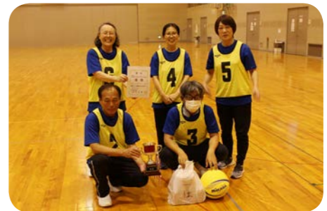
混成シニアの部 優勝チーム 第一豆田