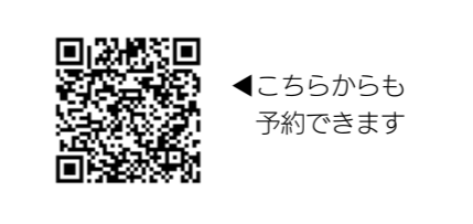
◀こちらからも予約できます

▶ 予約・問合せ 嘉穂・鞍手保健福祉環境事務所 健康増進課 精神保健係 ☎21・4875