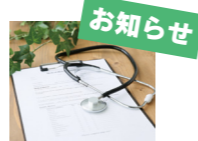
図 総務課 人事係 ☎65・1100