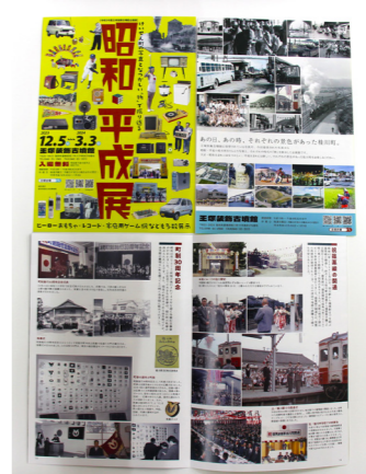
▲展示解説パンフレット

「物」で振り返る「昭和・平成展」 社会教育課 文化財振興係 王塚装飾古墳館では、令和5年12月5日(火)～令和6年3月3日(日)にかけて、令和5年度企画展「けいせん町の写真となつかしい「物」で振り返る「昭和・平成展」を開催しています。王塚装飾古墳館に保管されている写真や新たに提供された写真から、昭和・平成の桂川町の場面をとらえた写真と、それぞれの時代の「物」を展示しています。 昭和元年、桂川は村でした。炭鉱の開発などで人口が増え町制施行され今に至りますが、その間、様々な出来事がありました。各々の場面をとらえた写真と、当時の「物」をあわせ見ること、桂川町の「昭和」「平成」を紹介しています。 「懐かしい」と感じる世代の方がおられる一方、当時は全く知らない世代には過去のことなのに新鮮に感じられるかもしれません。 「忘れかけていた」「知らなかった」桂川町の姿を思い出しつつ、新たな気付きを共有できれば幸いです。 企画展の見学は無料で、ご来場の方には展示解説のパンフレットを配布しています。 なお、令和6年3月末まで、小学生は、福岡県内の美術館・博物館の常設展が無料で鑑賞できる「福岡県子ども美術館・博物館無料鑑賞事業」も実施中です。この機会に、ぜひ美術館・博物館を訪れてみてはいかがでしょうか。