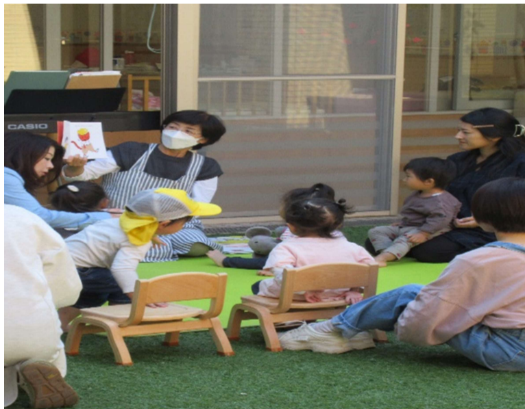
天気の良い日は、中庭で“絵本大すき”をしています。

*子育てに関する相談等も受け付けています。子どもさんのことは、もちろんですが、お母さんたちの気持ちも話してください。小さなことでも大丈夫です。ひとりで悩まず、まずは声をかけてみてください。