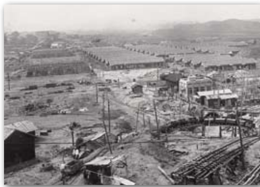
▲昭和初期頃の平山炭鉱を撮影した写真。右手前のトロッコが移っている上に少し見えるトンネルが第一坑の坑口。その上には社宅が立ち並び、左手建設中の社宅後方に長明寺が見える。