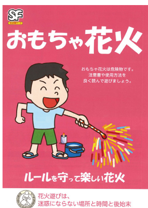
花火遊びは、迷惑にならない場所と時間と後始末