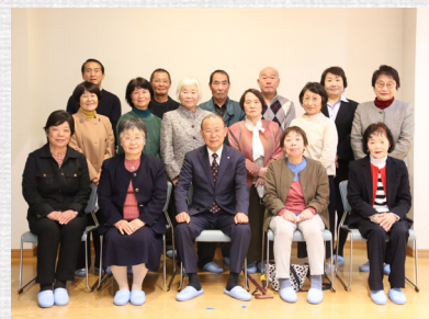
▲退任する民生児童委員の方々。