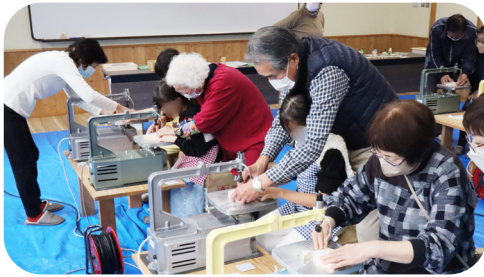
▲▼昨年の組み木体験の様子