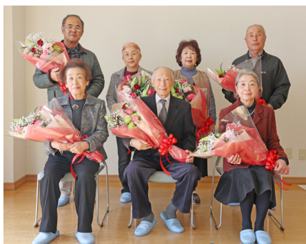
▲退任する民生児童委員の方々。